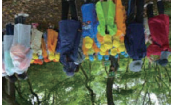
○国立大雪青少年交流の家「森のあそび場プログラム」