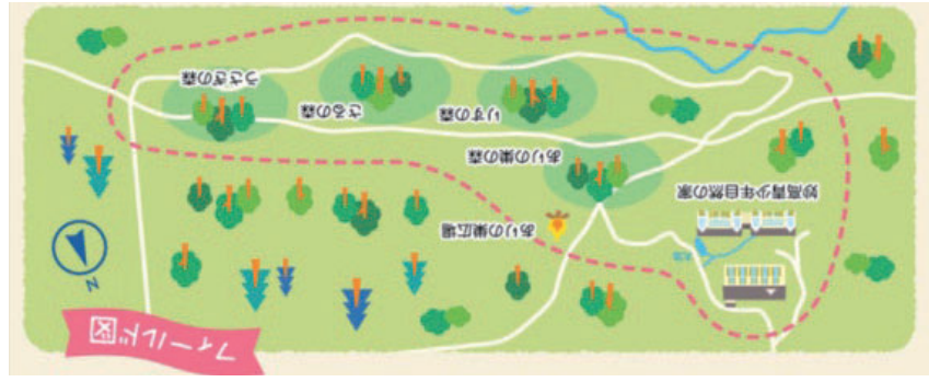
○国立妙高青少年自然の家「妙高の森遊び」