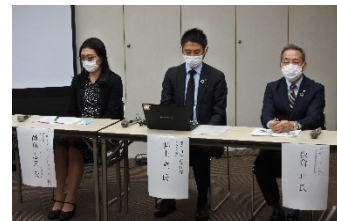
パネリストの皆様