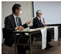
モデレーター、コメンテーター