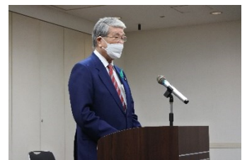
野村農林水産大臣